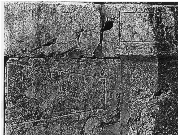
Abb.3: Die im Baptisterium eingemeisselten Messuren

Als Baudatum für das Baptisterium gilt das Jahr 1167. Wann die Längenmaße angetragen wurden sind, ist mir bisher nicht sicher bekannt, vermutlich aber in der Bauzeit.